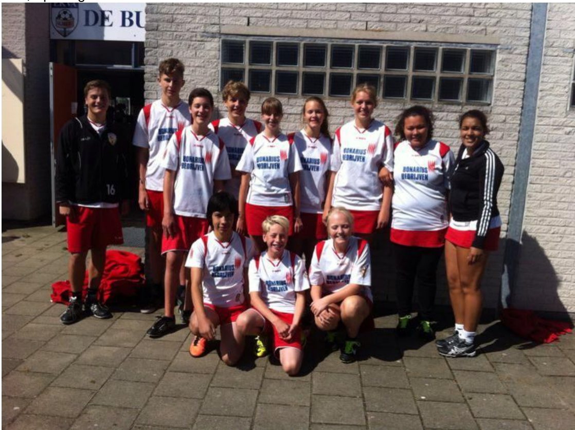
Foto, Sporting West A2

Het EKVA Toernooi zit er weer op! Qua resultaten is wisselvallig het juiste woord van het weekend! Gelukkig mocht het weer de pret niet teveel drukken! Vanaf volgende week de eerste competitie wedstrijden!